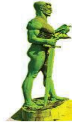
UDRUŽENJE MEDICINSKIH SESTARA, TEHNIČARA I BABICA ZDRAVSTVENIH USTANOVA BEOGRADA